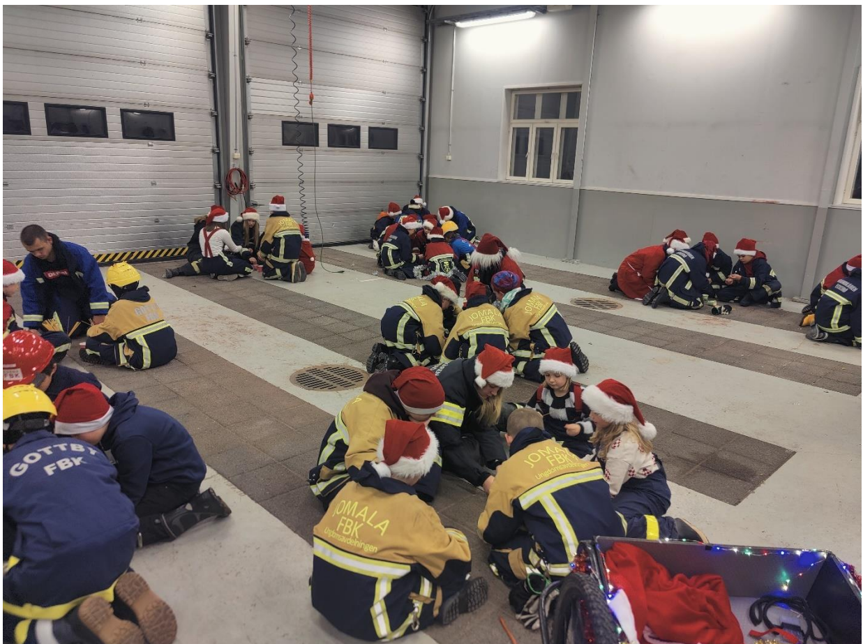
Många tomtar funderar över olika problemlösningar under glöggkvällen i Sund

I december avslutade vi vårt år med en glöggkväll på branddepån i Sund. 85 personer deltog från Eckerö FBK, Gottby FBK, Jomala FBK, Strandnäs FBK, Finströms FBK samt Sunds FBK. Programmet var en lagtävling i olika problemlösningar och vi bjöd på glögg, pepparkaka och saft. Under kvällen delades det ut pris för brandkåren med bästa jultema. Vi delade även ut diplomerna från Åm i slang- och pyttssprutestafetten som hölls under lokallägret i september.