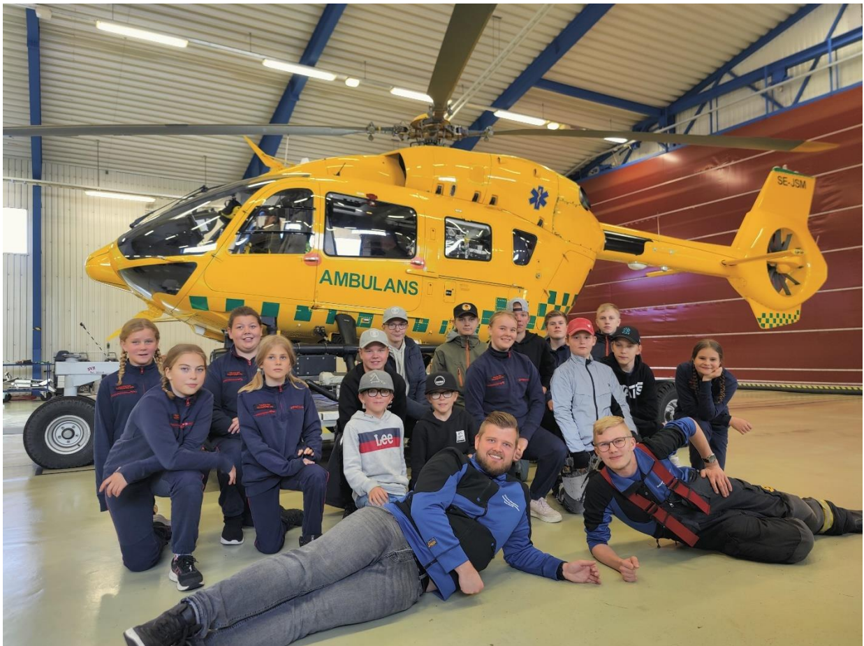
Deltagarna i FSBR:s tävlingsveckoslut för ungdomar

Utöver detta så har vi även under året stått värdar för FSBR:s tävlingsveckoslut för ungdomar i oktober. Det skulle hållas på Ålands Idrottscenter men ställdes in dagen före då majoriteten av deltagarna skulle komma med morgonfärjan från Åbo men den ställdes in pga hårt väder. Tolkis FBK kom med eftermiddagsfärjan på fredagen så de var enda laget som kom hit. Under lördagen ordnade ÅBRF tillsammans med Strandnäs FBK lite aktiviteter för dem, bland annat studiebesök på Räddningsverket och ambulanshelikoptern, de fick testa klaustrofobibanan på Alandica Shipping Academy samt lite filmkväll med tacos. Från Strandnäs FBK deltog ca 10 ungdomar.