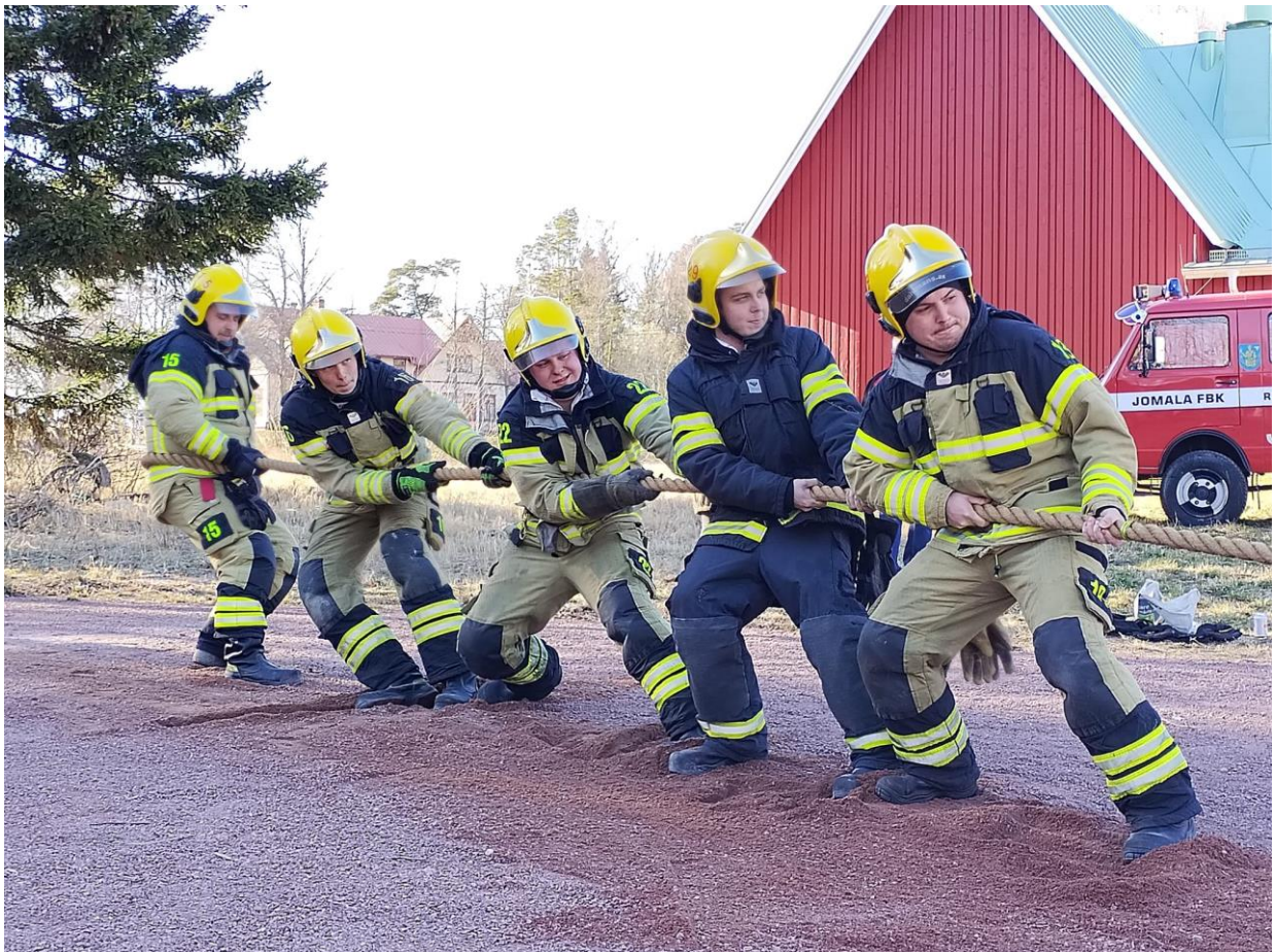
Jomala FBK gick segrande ur kampen i det första ÅM i brandmannadragkamp

Efter mötet avnjöts en tre-rätters middag följt av fritt umgänge.