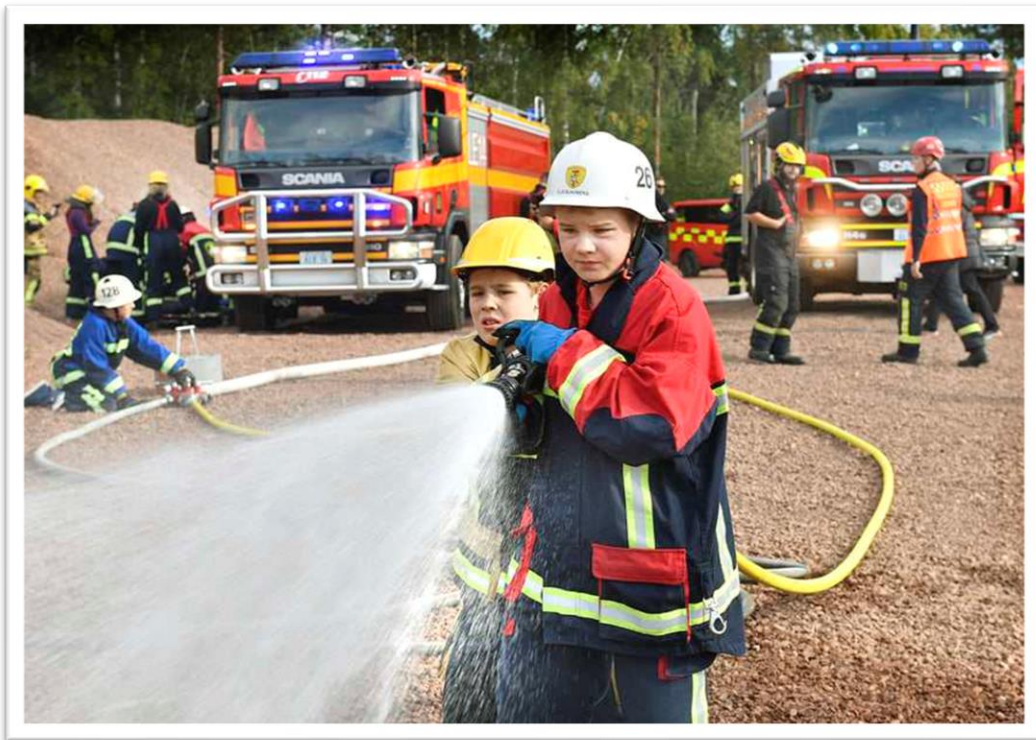
Full fart under lokalläget i Lemland i september