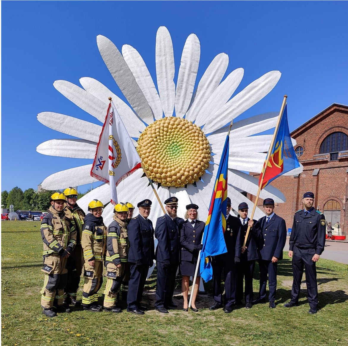
Uppställning vid Prästkragen efter paraden

Förbundet höll sin kongress och vårmöte den 27-28 maj i Åbo. Hela 24 ålänningar deltog.